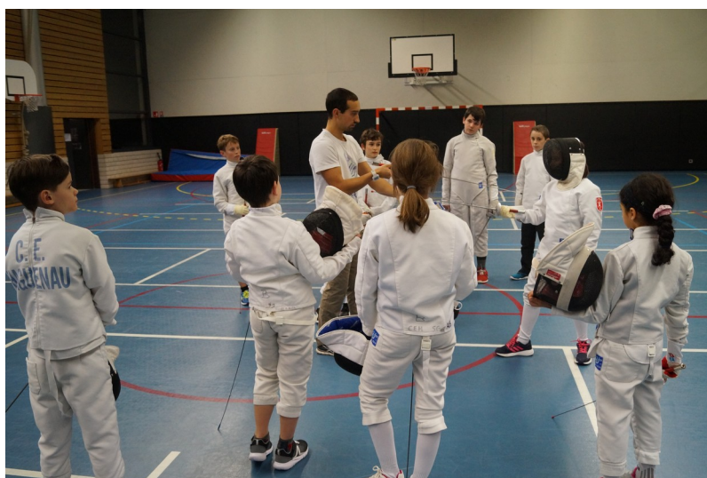
Amitiés sportives Le comité du Club d'Escrime de Haguenau