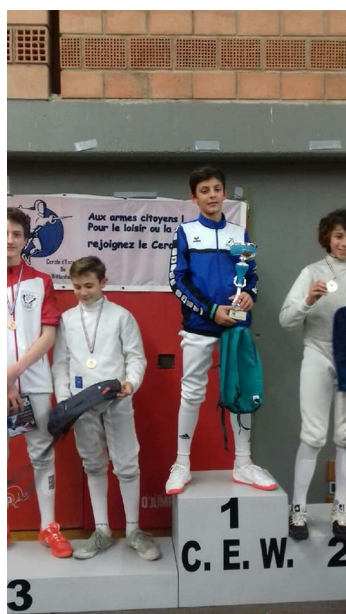
Pierre à Wittenheim