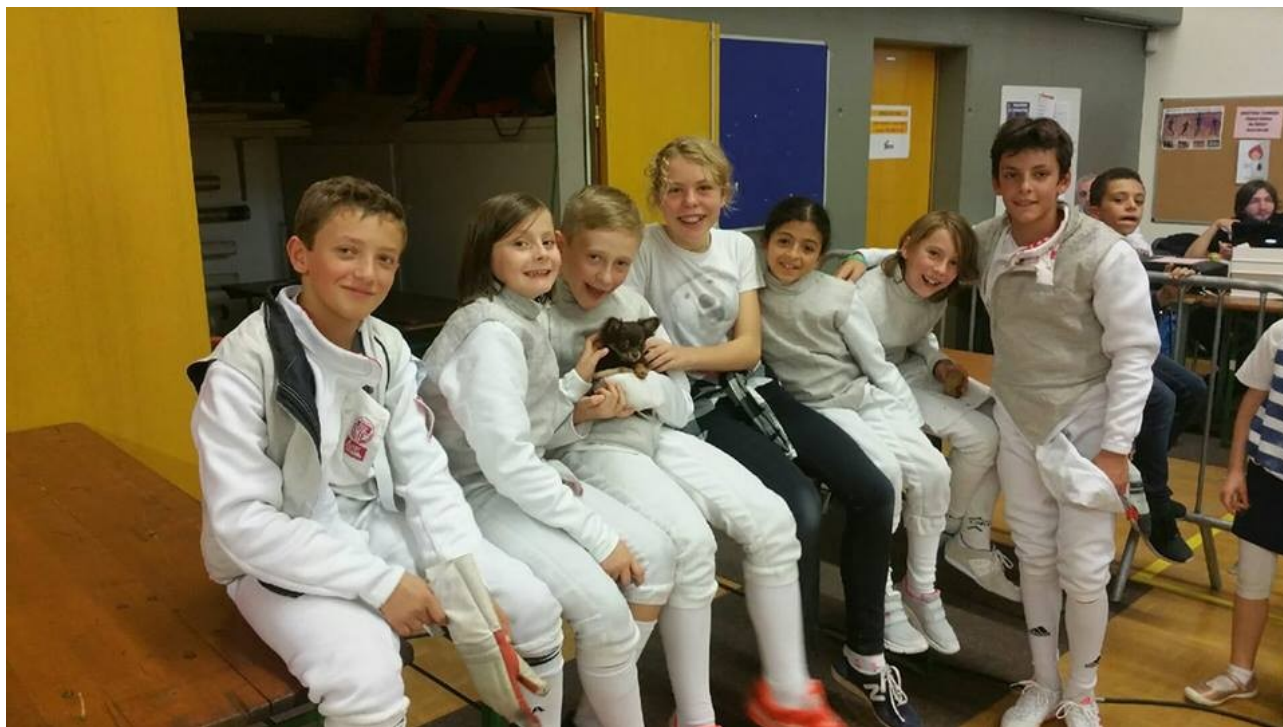
Un moment de détente à Wittenheim

A noter également la mise en place d'un cours débutants le lundi soir de 17h30 à 18h30