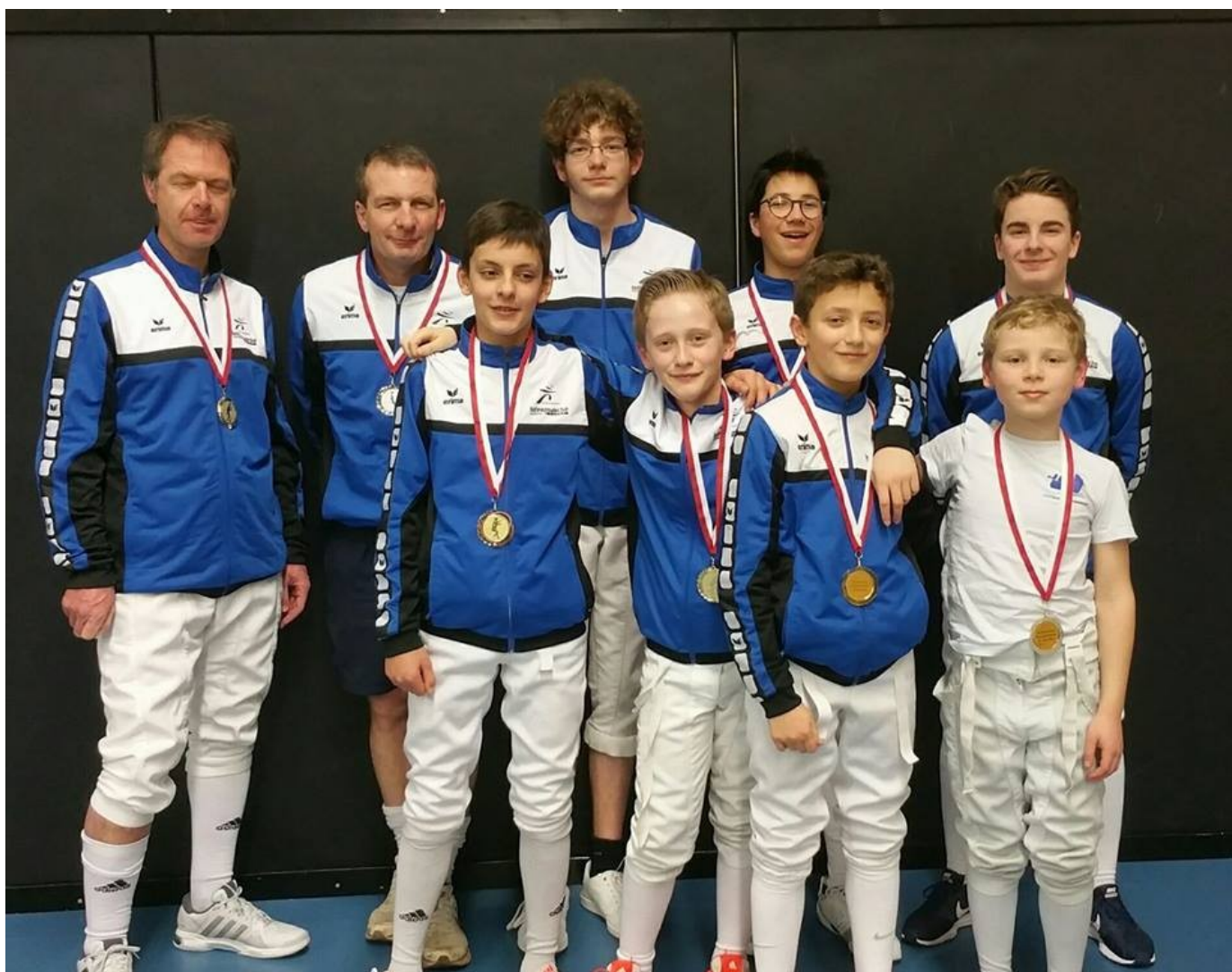
Les médaillés du CD 67 (Championnat départemental)