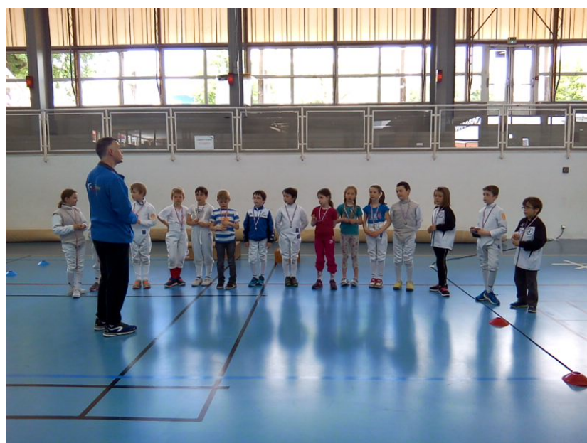
Tournoi des rois à Saverne

Amitiés sportives Le comité du Club d'Escrime de Haguenau